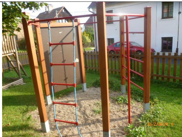
nedostatečný rozsah dopadové plochy