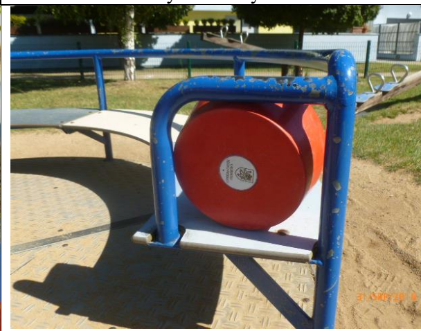
riziko zachycení hlavy na kolotoči