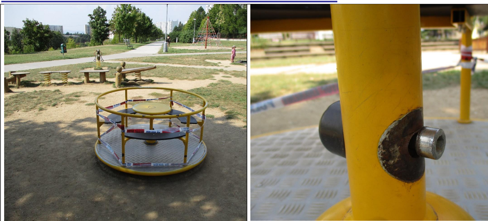
Kolotoč Brno - úraz – zachycení o nezakrytý šroub