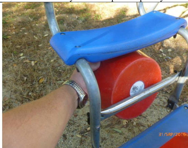
riziko zachycení hlavy v houpacím sedáku