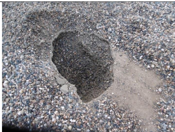
tvrdá krusta „v kačírku – snížené tlumení při pádu