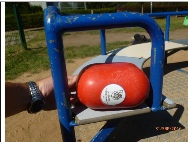
riziko zachycení hlavy na kolotoči