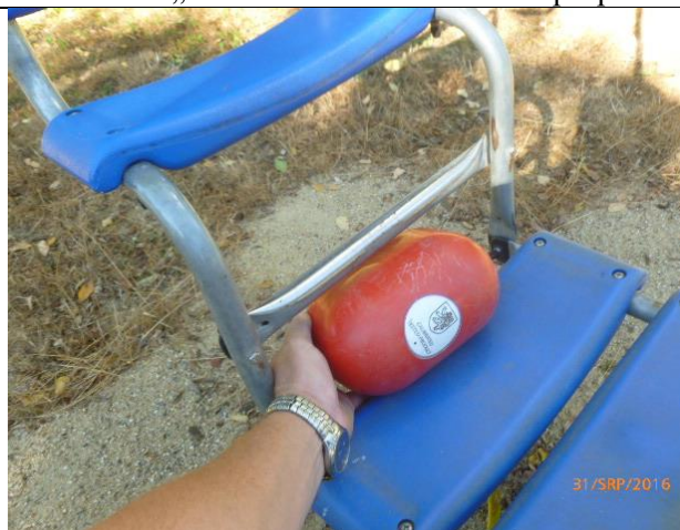
riziko zachycení hlavy v houpacím sedáku